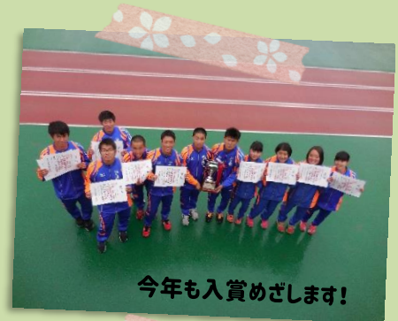
今年も入賞めざします！

A. 選挙管理委員長に挑戦したことが自己成長につながりました。立候補者の補佐から始まり立会演説会を迎えるまで忙しく過ごしましたが、無事に新しい生徒会メンバーを決めることができ安心しました。開志国際には1年を通して自分たちで準備して運営するイベントがたくさんあるので、どれもやりがいがあります！