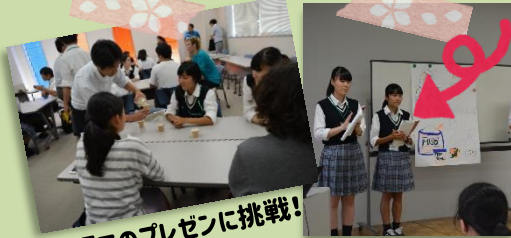
英語でのプレゼンに挑戦！

A. 地元を離れて開志国際に入学し、今まで経験してこなかったことが数多くあり、すべてが新鮮な1年間でした。寮生活を始め、自立心が芽生えたことは自分にとって大きな変化でした。普段の授業の他に、東進衛星予備校にも通って放課後学習も集中してしっかりこなし、毎日正しいリズムで生活できました！