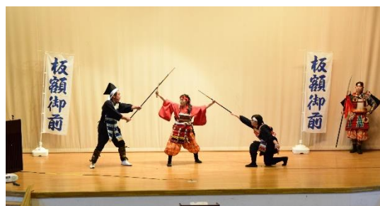
▲板額御前 演舞の様子

9/28(火)、1年生は総合的な探究の時間を使って、胎 内市の歴史について学びました。胎内市の中世・板額 御前の講演や歴史にゆかりのあるお寺の見学などを 通して、胎内市への理解をさらに深めました。