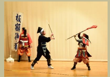
▲「板額御前」に胎内市の中世の歴史を学ぶ

1 学年は、総合的な学習の時間、1年間を通して胎内市の歴史について学んでいます。9/27(月)には、中世に活躍した「板額御前」の演舞の鑑賞、28(火)には歴史のある建造物の見学などを行いました。 開志国際高校では、在籍生徒の約7割が県外出身です。これを機に「胎内市」の魅力を少しでも感じ、愛着をもってもらえれば嬉しいですね。