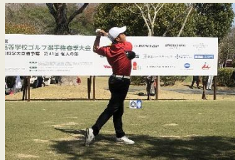
※写真は過去のものを使用しております